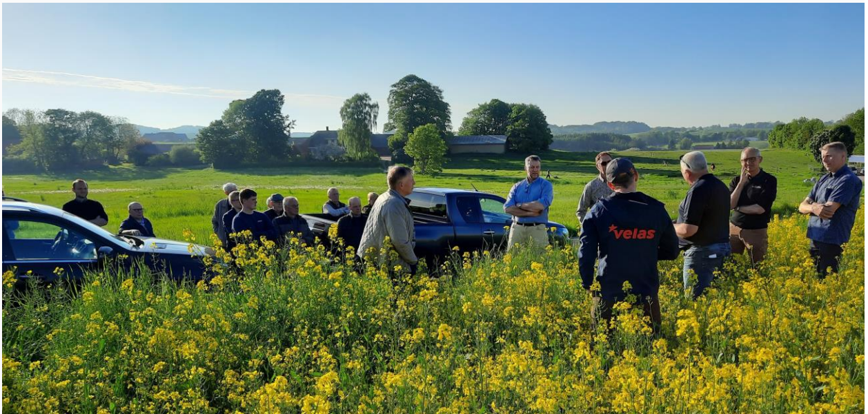
Bedriftsbesøg på Williamsborg om præcisionsjordbrug